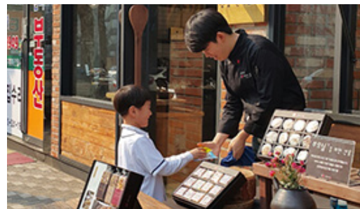
지난 주일 유년부·유초등부연합부는 부활절 달걀을 들고 나아가 노방전도를 하였다.