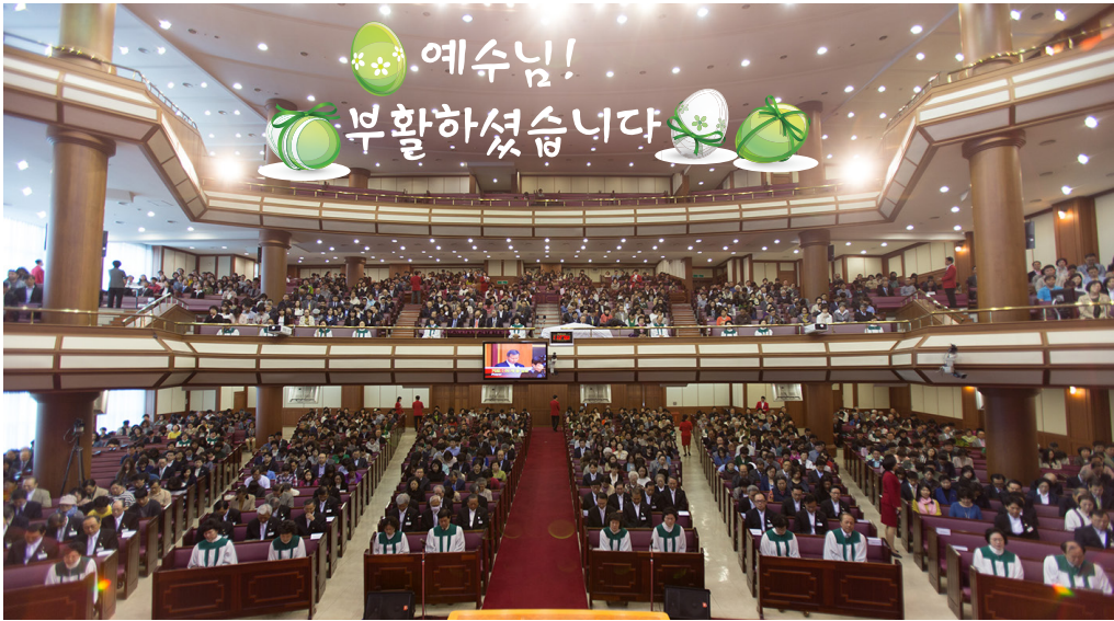
지난 주일 부활절을 맞아 주일 I, II, III부 예배 시간에 성찬식을 거행하였다